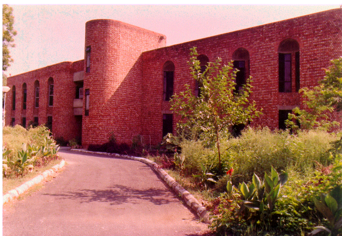
International Monitoring & Receiving Centre, Todapur, New Delhi

International Monitoring & Receiving centre situated at Todapur, New Delhi, is engaged in carrying out broadcast signal monitoring of MW, SW, FM and DTH signal carrying internal and external services of AIR and MW & SW Foreign broadcasters service towards INDIA. The activities carried out during the current financial year are given below: