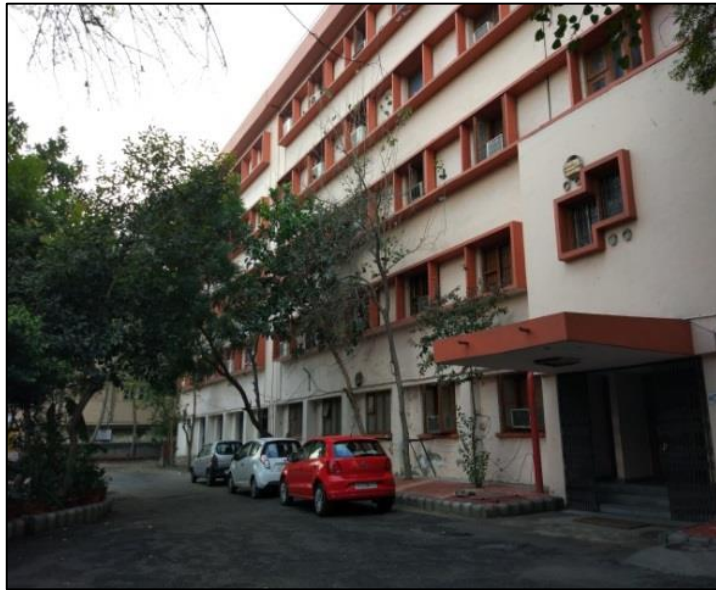
Research Department, AIR & DD