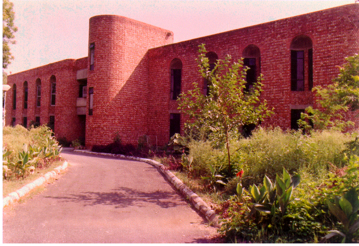
अन्तर्राष्ट्रीय अनुवीक्षण एवं अभिग्राही केन्द्र, टोडापुर नई दिल्ली

टोडापुर, इन्द्रपुरी, नई दिल्ली में स्थित अन्तर्राष्ट्रीय अनुवीक्षण एवं अभिग्राही केन्द्र आकाशवाणी की देशी एवं विदेशी सेवाओं के मध्यम तरंगों, लघु तरंगों, आवृत्ति मॉडुलन एवं डी टी एच प्रसारण संकेतों का अनुवीक्षण करता है। वर्तमान वित्त वर्ष की अवधि के दौरान की गयी गतिविधियों का विवरण निम्नलिखित है :-