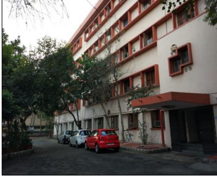
अनुसंधान एवं विकास विभाग